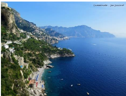
Costiera amalfitana - Panorama da Conca dei Marini